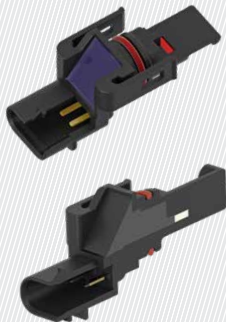
Drehwinkel-Hall-Sensor in der End-of-Shaft-Montage