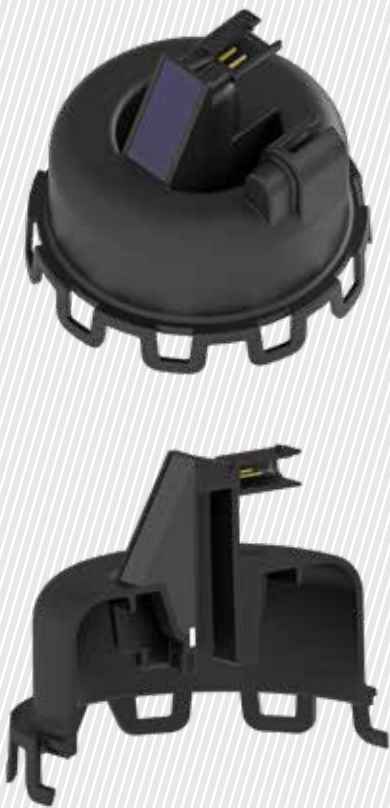
Linear-Hall-Sensor integriert in den Aktuatordeckel der Unterdruckdose